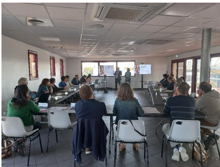
Réunion du GAL 08/04/2025 Salle des arènes de Parentis-en-Born