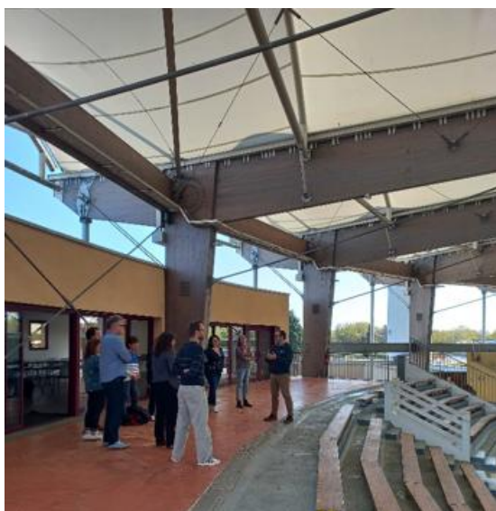
Visite commentée des arènes de Parentis-en-Born cofinancées par l'Union européenne programme LEADER 2014-2020