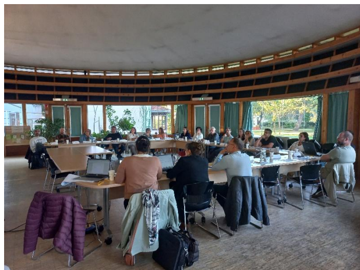
Réunion du 30/09/2025 Salle de la Rotonde de Mimizan