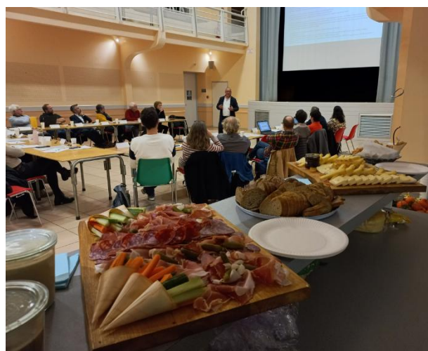
Réunion du 25/11/2025 Salle des fêtes de Saint-Julien-en-Born